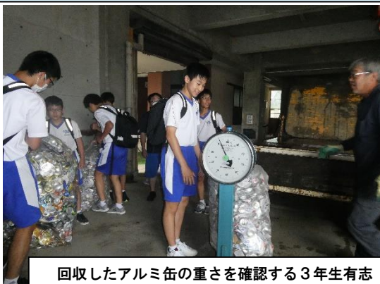
回収したアルミ缶の重さを確認する3年生有志