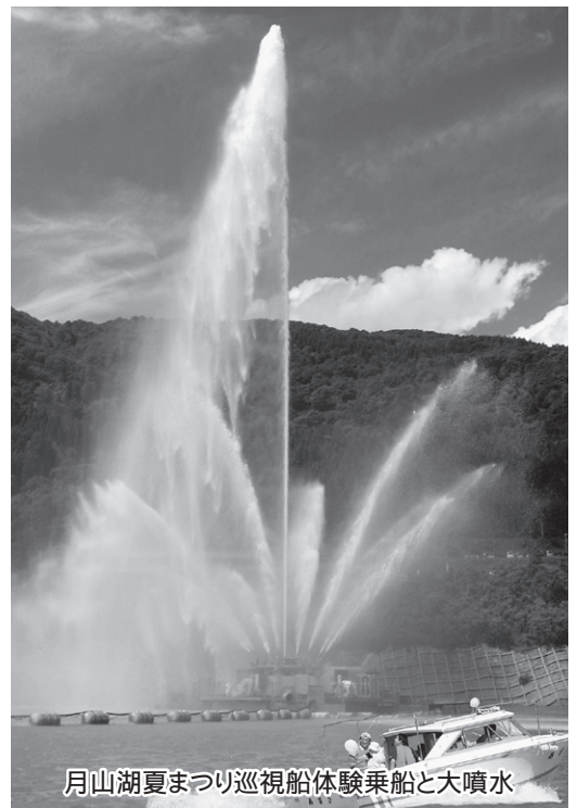
月山湖夏まつり巡視船体験乗船と大噴水

ダム右岸の管理用道路の活用については、以前にウォーキング等でも利用しましたが、安全性の面もあり継続できなかった経過もあります。今後、一般開放と毎年継続的にウォーキング等を中心としたイベントができないか関係機関と検討していきます。