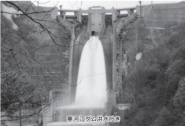
寒河江ダム洪水吐き