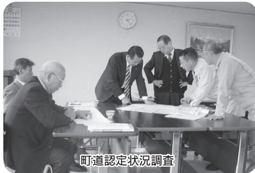
町道認定状況調査

結果は、議会に報告すべきではないか。また、町道認定した後でも、社会情勢の変化等で廃止することも必要なのではないか」などの意見が出されました。