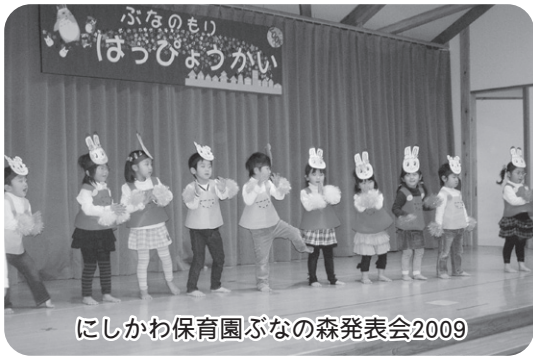
にしかわ保育園ぶなの森発表会2009