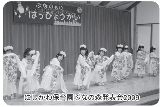
にしかわ保育園ぶなの森発表会2009