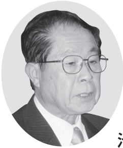
池上 博 議員