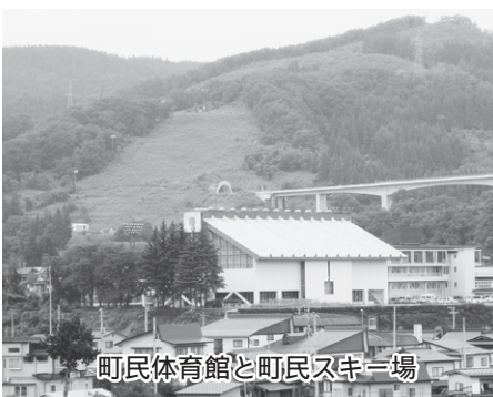
町民体育館と町民スキー場

若者の勤労者や低所得者のための定住促進のための施設としての必要性は理解しますが、これから進めようとしている人口集積地の住宅団地整備などなかで定住促進対策を考えています。