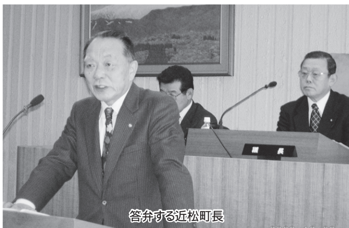
答弁する近松町長