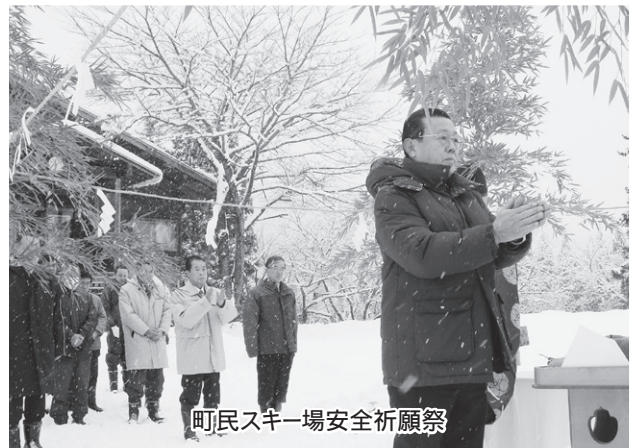
町民スキー場安全祈願祭

道では、本町の実質公債費比率が20・2%で、18%以上は本町を含めて7町村。借金をするのに県の許可が必要になります。本町では、西川小学校建設に邁進しており、財政面で心配する声が多くありますが。