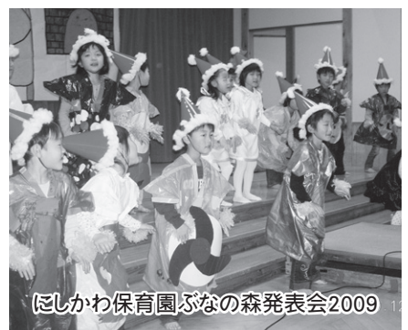
にしかわ保育園ふなの森発表会2009

が先の審議会で取り上げられましたが、今後の対応は。また、平成22年4月の町長選挙にあたり近松町長の考えは。