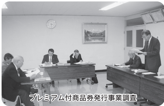
プレミアム付商品券発行事業調査

意見交換では、「商品券がすぐに完売したために、購入できなかった方もいるのではないかと町が補助金を出しているの、平等性を考えながら継続してほしい」などの意見が出されました。