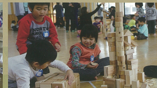
西川保育園への積み木プレゼント