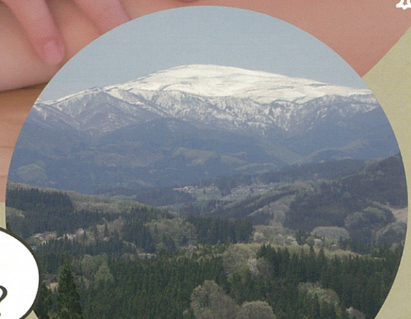
月山のすそ野に広がる 西山杉林