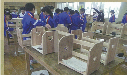
西川中学校木工教室