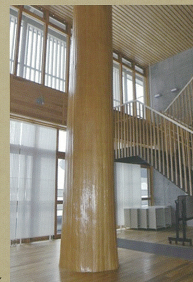
西川小学校ホール

また、西川小学校の校舎には、多くの西山杉を使用しています。子供たちには豊かな自然と地域とともに、健やかに成長してほしいと願っています。