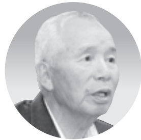
宮林 昌弘 議員