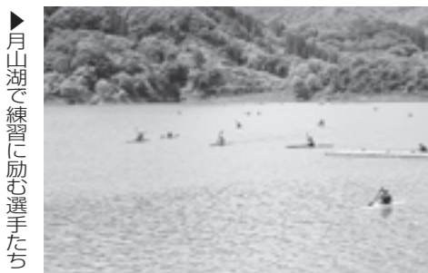
月山湖で練習に励む選手たち

大会開催による町内宿泊数や町内消費等、観光や商工業への経済効果を考慮し、大会全体を捉えながら次回開催に反映していきたい。