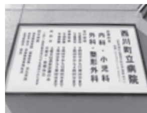
▲屋外に掲示されている診療科目

問 整形外科の医療体制を充実強化すべきだ。整形外科の多くの患者が町外に流れている。リハビリを含め医療体制の充実強化をどう考えているか。