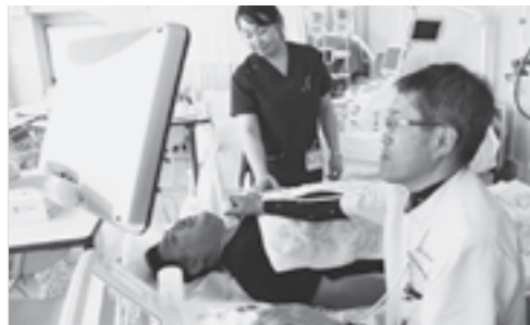
▶超音波検査の様子

西川町立病院が安定した経営の下で安全、安心な地域医療を継続的に担っていくことができるように、病院新改革プランが策定された。 「キラリ☆月山健康元気にしかわ！」をスローガンにした第6次総合計画に掲げた10年後の目標人口5000人を維持するために、病院の役割は極めて大きい。医療体制の充実によるサービスの向上を図り、病院の経営安定化と維持、存続を求めるため、次の質問をする。