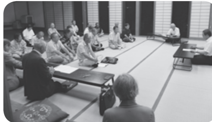
▲ 昨年の海味地区の様子