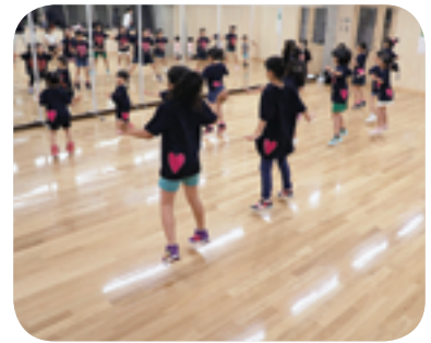
▲鏡でダンスをチェック

当初のメンバーはたった一人でしたが、今では子どもたちだけでなく、お母さん方も参加してくださるようになり、より華やかなクラブへと成長しています。年を追うごとに活躍の場を広げて、現在は町内外の様々なイベントでダンスを披露しています。その中でも、特に大きな目標としているのが「西川町文化祭」です。普段はしないような髪型や衣装に、お母さん