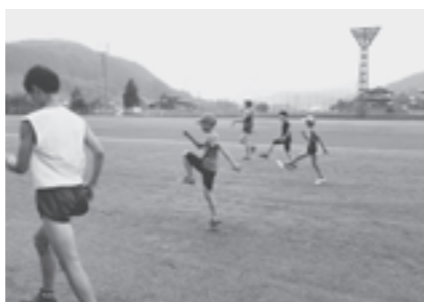
ジュニア駅伝の練習