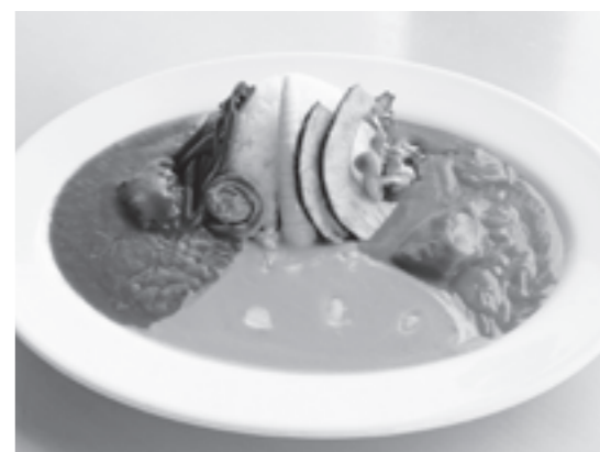
▲月山湖水の文化館2階のレストランの新メニュー「寒河江ダム四季カレー」

料費など上昇要因(総額660万円)をカバーし、営業利益、経常利益、当期純利益とも前期より増となりました。 ※表1を参照