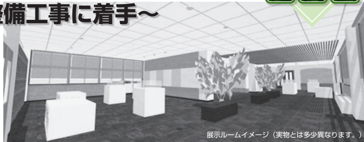
展示ルームイメージ（実物とは多少異なります。）