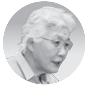
飯野 咲子 議員