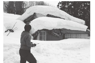
▲西川町の空き家は冬に注意

働く場所の確保が重要であり、起業・創業が相次ぎました。町内には8社の第三セクター及び地域商社があります。町は、地域商社や町内企業に地方創生の取り組みを委託することで、雇用を拡大し、町内の資金循環を図っていきたく。トップセールスによる企業誘致も徐々に成果が出てまいりました。4年間で数社の企業が進出、西部地区では小水力発電所の建設が進んでおり、固定資産税の獲得にもつながります。