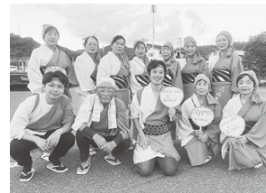
▲三山音頭を踊る会の皆さま

「すっだいこと(やりたいこと)」を叶えるためには、伴走する人、資金面で支える人など、互いに支え合う仕組みが欠かせません。町の中にこうした支え合いの仕組みが次々と生まれれば、「寛容性」の高い地域となります。「寛容性の高い地域は人口が増える」という民間統計のデータもあります。寛容な町民の皆様が主体となって活躍することで、人口増という「奇跡」を起こすことができます!