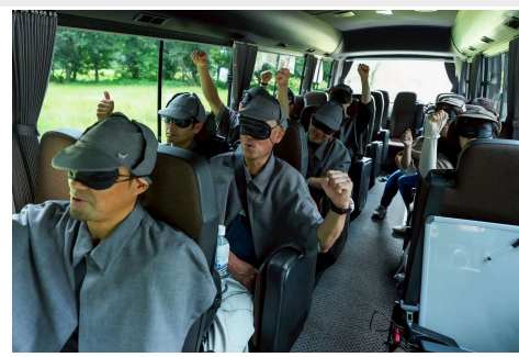
推理力とチームワークが事件解決のカギ

オンラインゲームをクリアした者だけが挑戦できる体験型ミステリーイベントでは、参加者は特製の探偵衣装を着用。ガイドと共にバスで町を巡り、プロの俳優や西川町民が出演したドラマ映像、岡本信彦氏のボイスキャストを頼りに事件解決に挑みます。