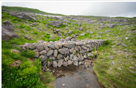
月山山頂付近に実在する謎の石橋「天空石橋」