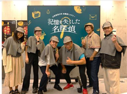
特製の衣装を着て記念写真を撮る参加者たち