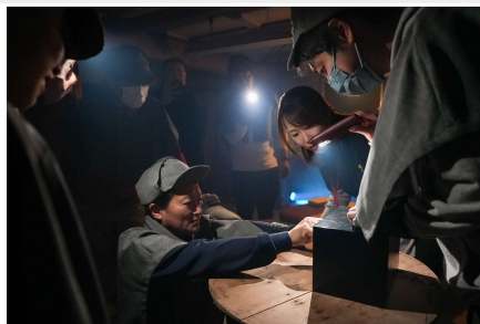
ミステリースポットへと再生された空き家