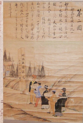
旧川土居村役場の会議室に、啓蒙のため飾られていた掛図