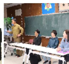
インタープリター（自然解説員）のみなさん