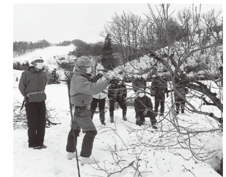
▲枝木剪定講習の様子(上間沢)

西川町シルバー人材センターで3月3日・4日の2日間、会員11人を対象に「果樹剪定講習会」が行われました。これは冬期間に同センターに依頼が増える果樹の剪定について、会員の技術向上を目的に開催されたものです。当日は県西山農業者普及課の斎藤氏による学科講習が行われ、その後、町内で梅や柿の枝木の適切な