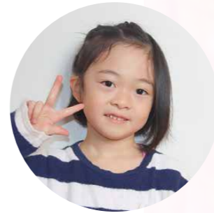
かけた わか 掛田 和夏