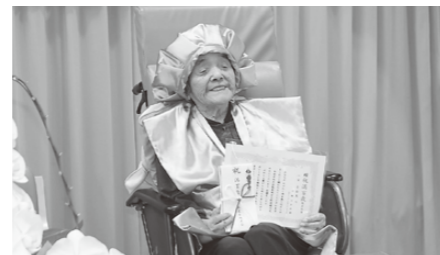
本道寺地区からの「お祝いの品」を受け取り笑顔