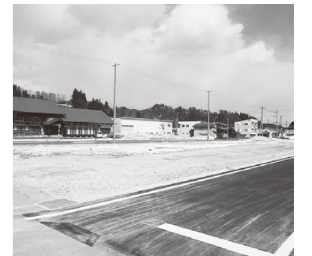
▲町営住宅建築予定地

今後、町で建築していく建物の木材については、町産の西山杉を活用し、町産材の需要の促進を図っていきます。また、西山杉の魅力を発信するため、建築工事の節目や完成後の内覧会を開催します。 町営住宅のPRとして、動画作成やSNSを活用し、若者世代に魅力が伝わるように情報発信していきます。