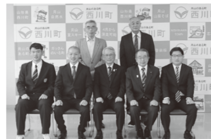
▲自衛隊入隊者激励会の様子