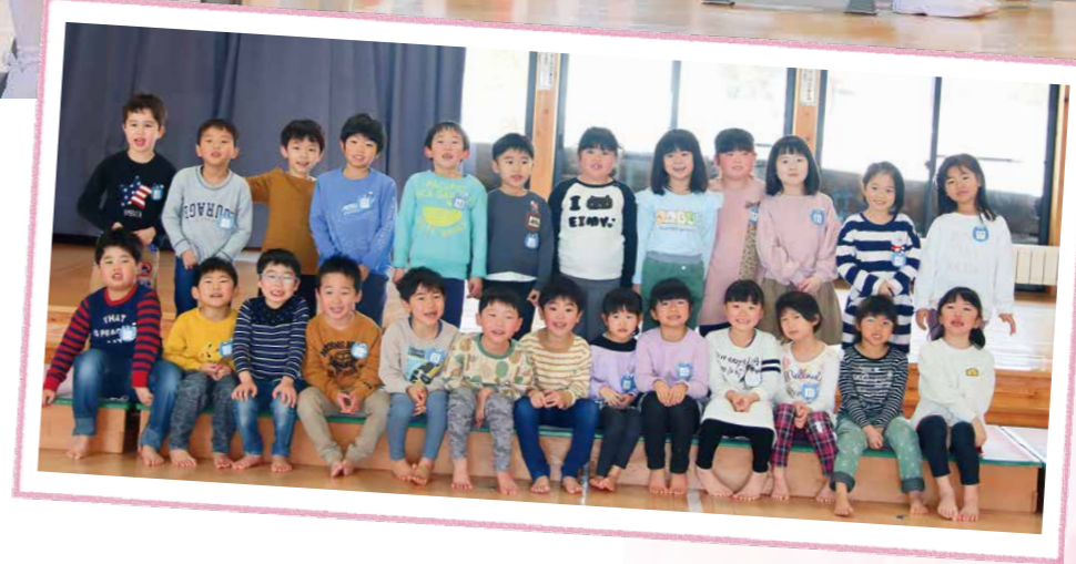
◀「キラリ☆そら組」が 1年生になりました！