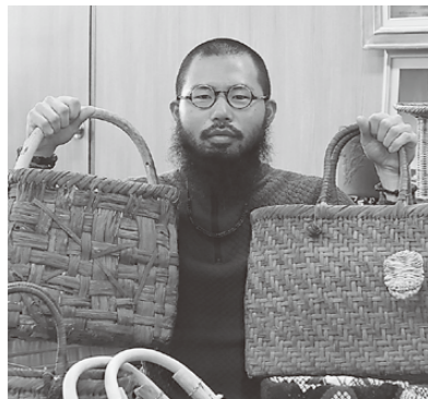
▲よろしくお願いします！

特に私が興味を持ったのは、大井沢に残る伝統的な生活文化です。つる細工やわら細工、かんじきづくりなどの手仕事、山菜やキノコなどの食文化。それら地元の方々から継承し、発信・交流の拠点となる宿をつくるのが、いつしか自分の夢になりました。 これからは開業に向けて動く一方で、現在制作に取り組んでいるつる細工をはじめとした仕事の情報発信、体験プログラムの開催などを行っていきます。地元の方からは「子熊」と呼ばれるような見た目をしていますが、町民の皆さんに応援してもらえよう、精一杯頑張ります！これからどうぞよろしくお願ひします。