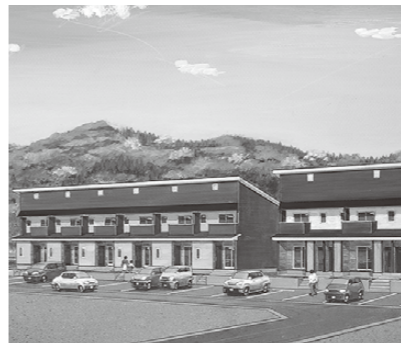
▲町営住宅完成イメージ図

集合型賃貸住宅は、単身用に1LDK重層タイプ6世帯分1棟、子育て世帯用に2LDKメゾネットタイプ6世帯分1棟と、3LDKメゾネットタイプ4世帯分2棟の整備を計画しています。3LDKの1棟は、町内の企業が借り上げてシェアハウスとしての利用を想定しています。1LDKと2LDKの部屋は